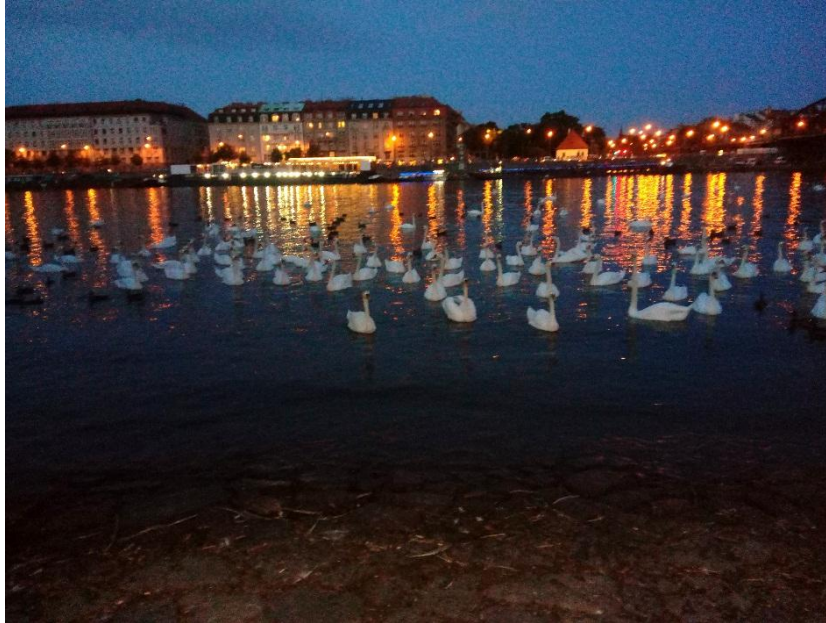
Obrázek č. 6 - Krmení labutí před Železničním mostem.

Přestože jsou někteří informanti na okolí svého bydliště tak pyšní, že se o něj budou rádi dělit s lidmi se širokého okolí, ba i s turisty (v rozumné míře), tyto jejich tendence limituje právě nedostatečná kultivace, ale i zabezpečení prostředí.