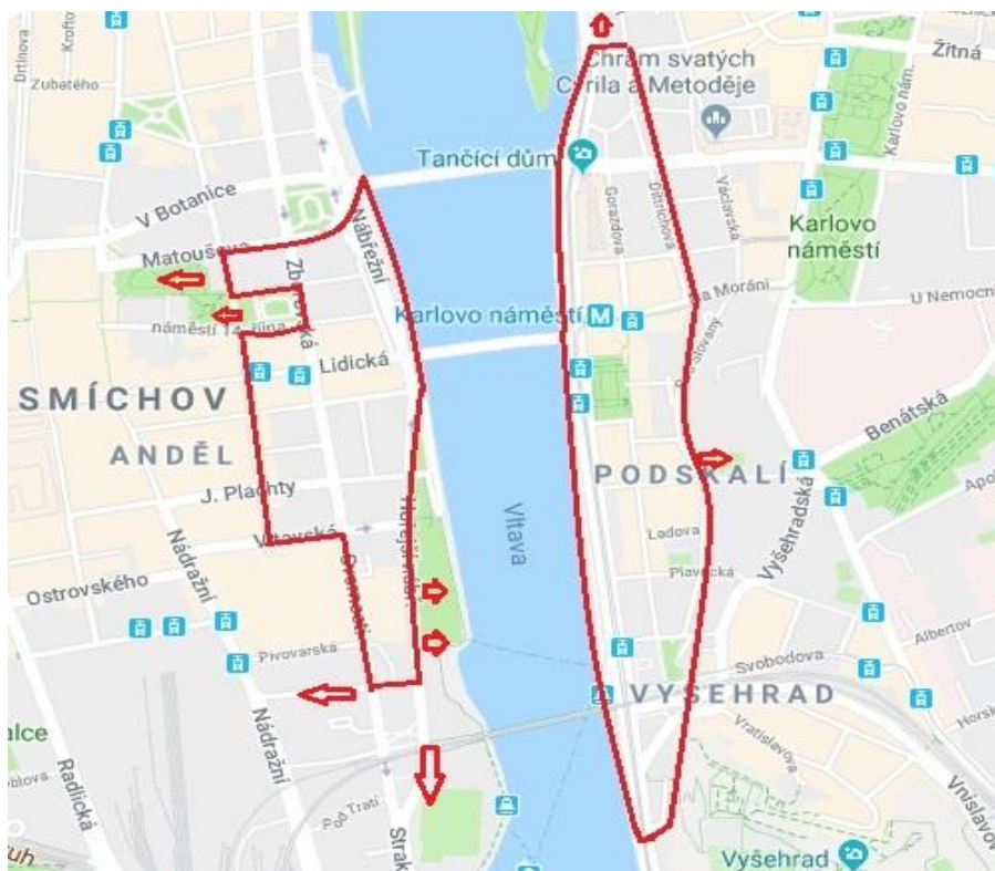
Obrázek č. 1 – Vymezení zkoumané oblasti

Na mapě je znázorněna výzkumná oblast. Červenou linkou je na levém břehu Vltavy vymezená rezidenční oblast v okolí Hořejšího nábreží, na kterou jsme se nejvíce zaměřily. Všechny oslovené subjekty (majitelé domů, SVJ, BD, subjekty sociálního podnikání, kreativního průmyslu a subjekty podnikání v pohostinství) sídlí v jejím rámci. Šipky pak