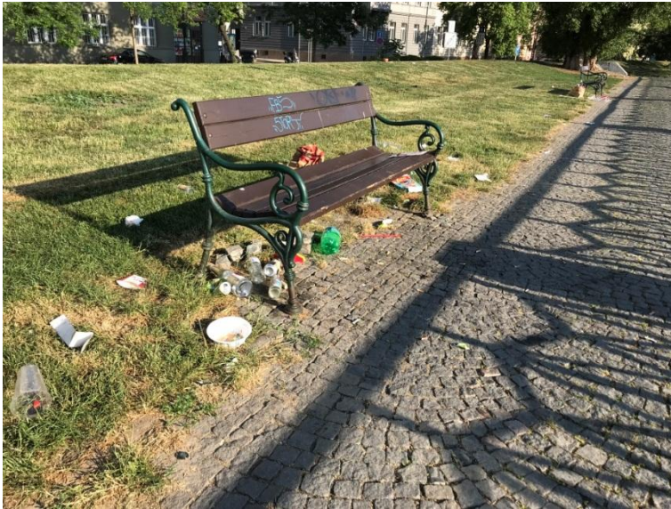
Obrázek č. 7 – Nepořádek v parku

„Máme doktorku (dětskou) na druhý straně, tak jsme využily přívoz. Viděla jsem to tam 3x denně v různou denní dobu a na lavičkách vedle skateparku byli bezdomovci, lidi tam močili na trávu, byl tam někdo, kdo hulil (marihuanu), bordel. Tenhle trend to nemělo. Tomu by to oživení mohlo pomoci.“ (rezidentka z oblasti protějščího nábřeží, cca 38 let)