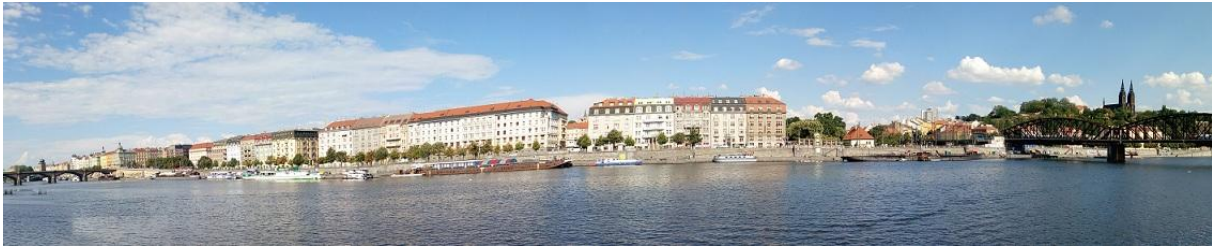
Obrázek č. 7 – Výhled z Hořejšího nábřeží

„Chodím na Náplavku s pejskem vždy dopoledne. Dám si cigárko, koukám na parníky a lodičky a jsem spokojený. Uvítal bych, kdyby aspoň někde byli pytlíky.“ (rezident - pejskař cca 50 let)